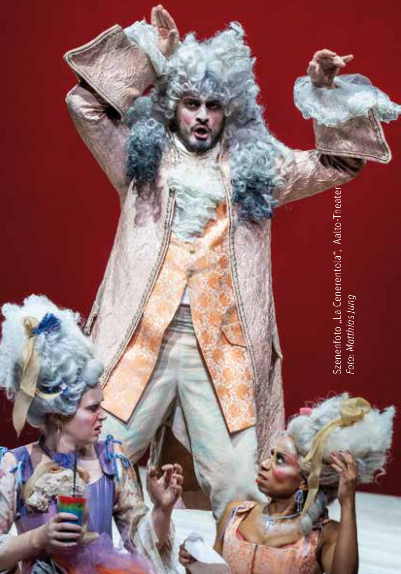
Szenenfoto „La Cenerentola“, Aalto-Theater