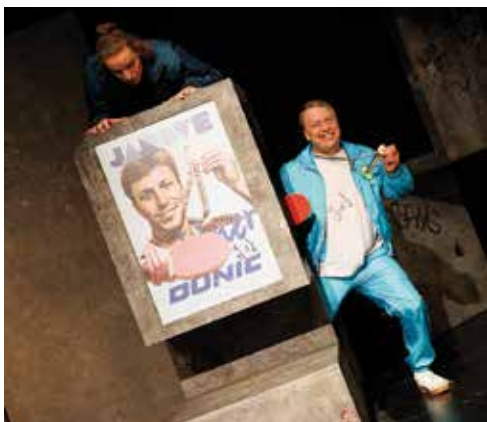
Szenenfoto „Schmetterball“ Studio Oberhausen