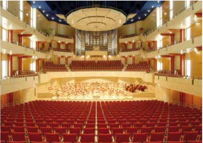
Philharmonie Alfred-Krupp-Saal