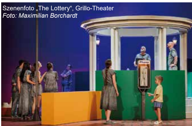
Szenefoto „The Lottery“, Grillo-Theater