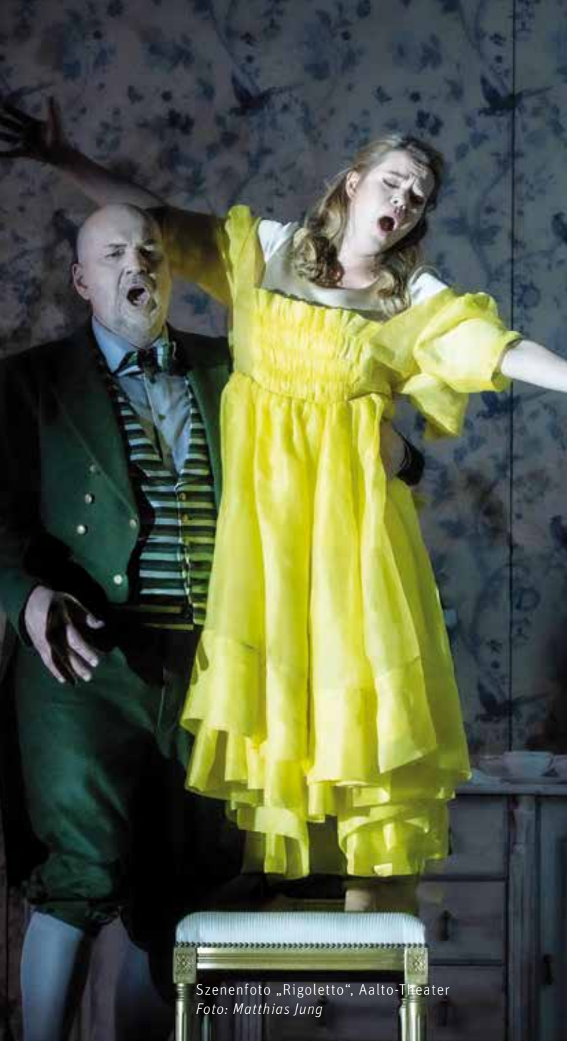
Szenenfoto „Rigoletto“, Aalto-Theater