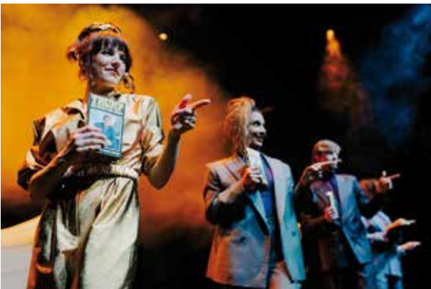
Szenenfoto „Die Kunst des Deals“, Schauspielhaus Bochum