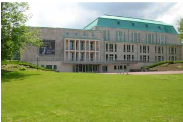
Philharmonie Essen

Werke von Antonio Vivaldi, Charles Avison, Giovanni Solli- ma, Igor Strawinsky und Carl Philipp Emanuel Bach